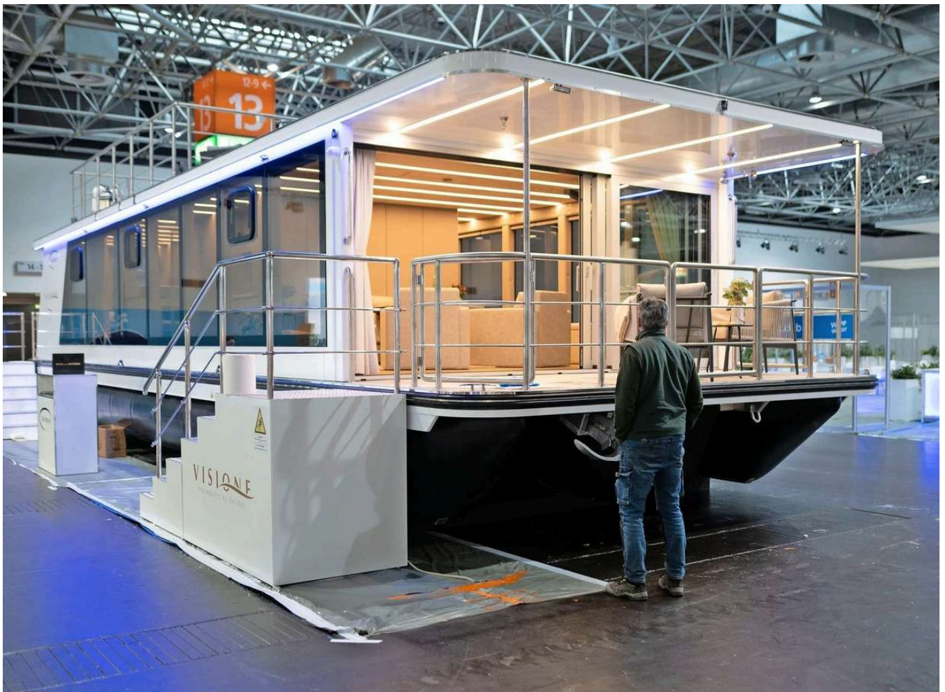
Langsam, aber gemütlich: Das Hausboot Vision One der litauischen Werft Desidus ist mit einer Sauna ausgestattet. Fabian Strauch

Genau andersherum verhält es sich mit der Vision One der litauischen Werft Desidus. Das Hausboot, 16 Meter lang und 4,80 Meter breit, hat eine bewohnbare Fläche von rund 70 Quadratmetern und ist von einer ähnlich großen Terrasse überdacht.