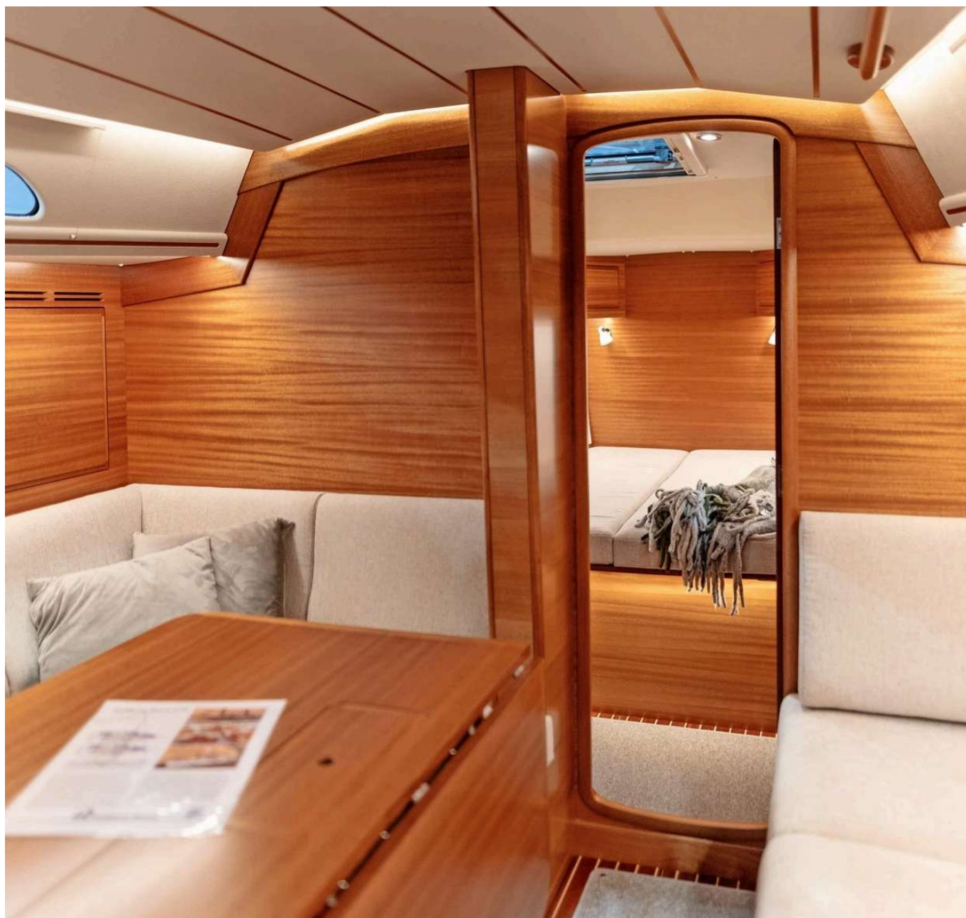
Zimmer mit Aussicht: Das eher klassisch orientierte Interieur der Hallberg-Rassy 370 Fabian Strauch

Charme einer Fahrtenyacht. Es kann mit einem Teakimitat auf Polyurethanbasis ausgekleidet werden oder mit echtem Teak, was sich natürlich im Preis niederschlägt.