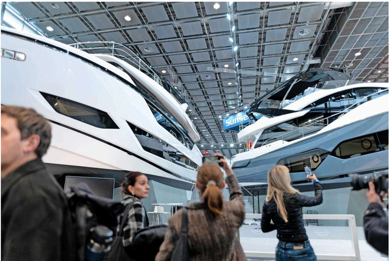
Auf dem Trockenen: Die Superyachten passen gerade noch so in die Messehalle. Fabian Strauch

Nur bringt die Windräderwand uns vom Thema ab, ob wir nun ein Boot brauchen und, wenn ja, wie viele. Da sind wir uns selbst nach den schönen Segelbooten noch nicht ganz sicher. Uns dämmert aber bereits, dass wir mit genügend Zeit und offenen Augen nicht umhinkommen könnten, uns zu fragen, ob es nicht wenigstens eins dieser eleganten Gefährte sein sollte.