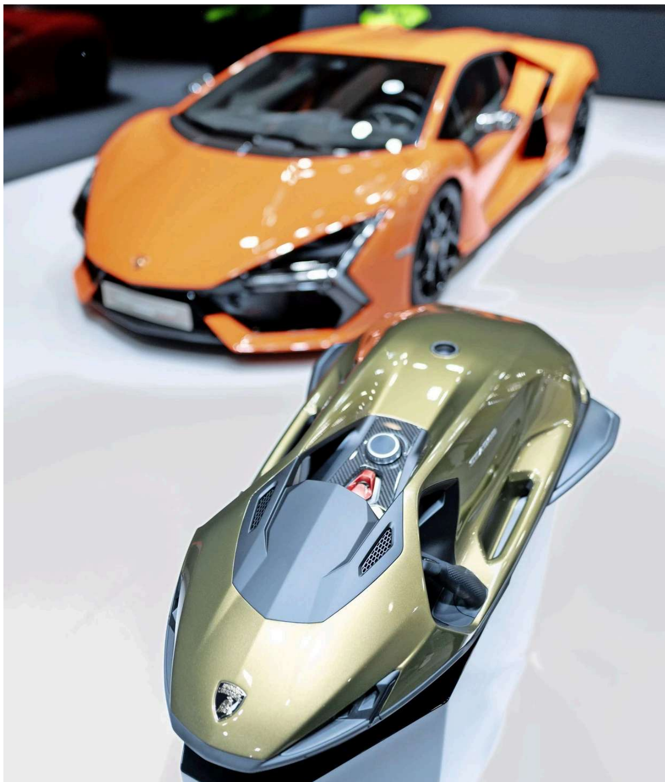
Lambo Zambo: Kooperationen mit Autoherstellern sind in Mode Fabian Strauch

seinen Reiter ziehen, bis zu drei Meter in der Standardeinstellung. Wer sich seiner Sache sicher ist, kann ihn so einstellen, dass es in Tiefen von bis zu zehn Metern geht.